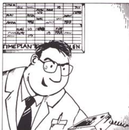
Fællesmeddelelse til alle klasser.

F.eks.: Skoleinspektøren informerer om det forestående idrætsstævne.